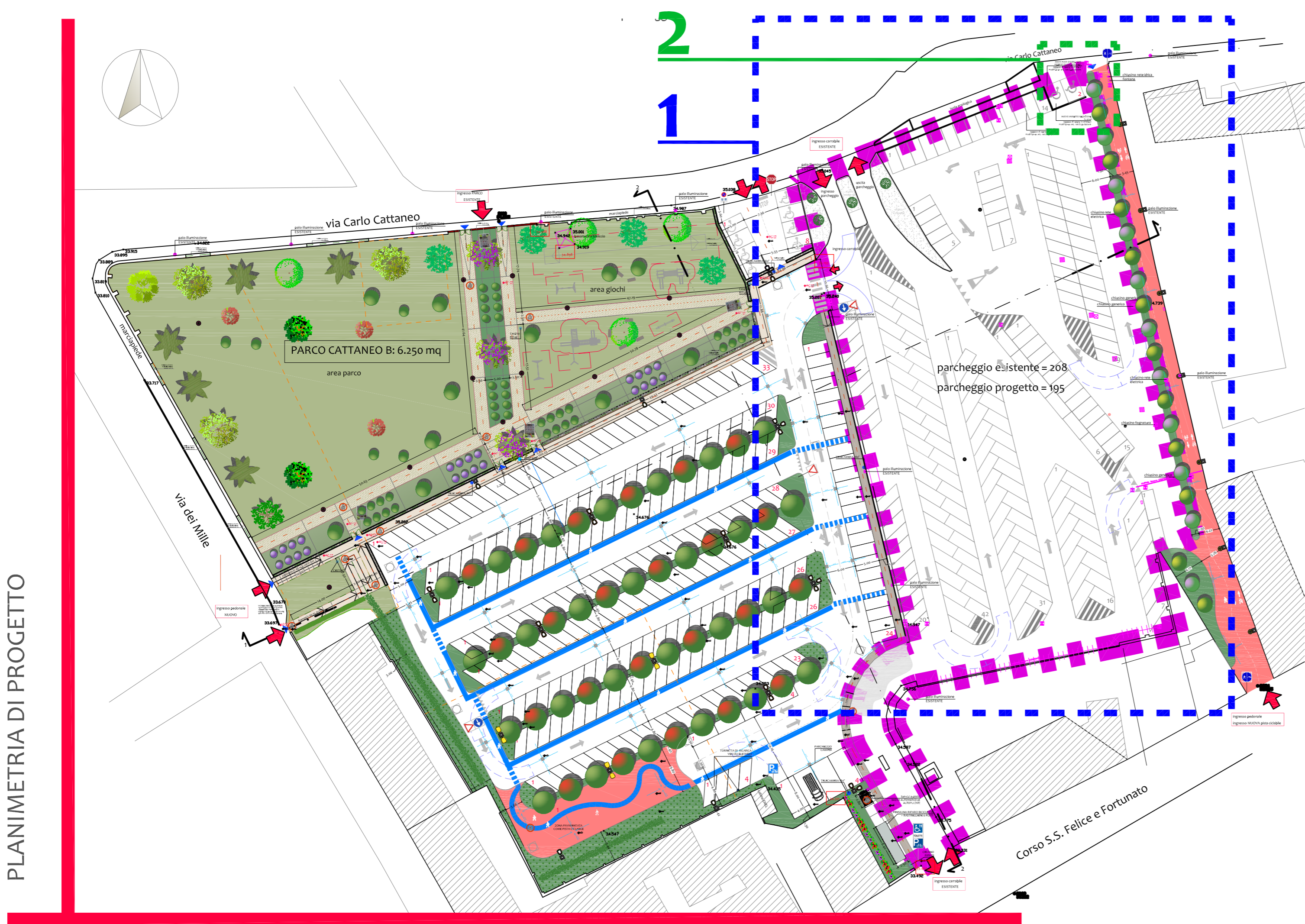
Particolare 1: Parcheggio Cattaneo A esistente scala 1:200